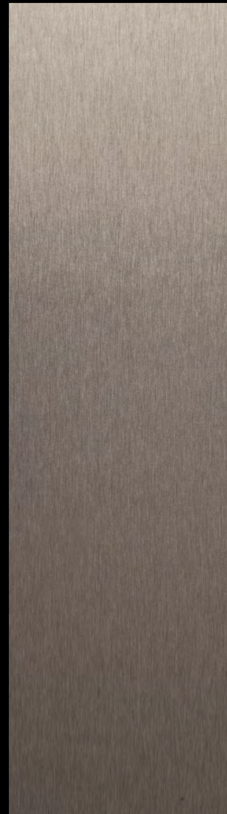
FX 5000 Acciaio Hamilton