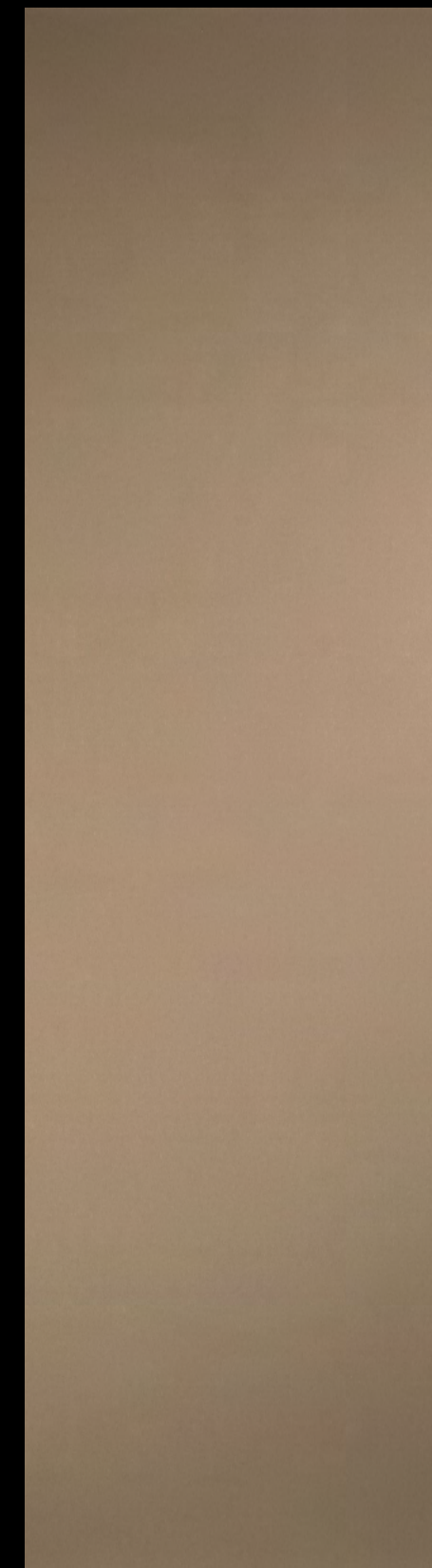
451 SRM Alu-Strichmatt Bronzeton Alu Brushed Bronzeton Alu mat ton bronze