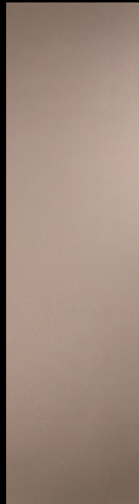
454 SRM Alu-Strichmatt Roségold Alu Brushed Rosegold Alu mat or rose

FR Parce que les métaux se comportent si différemment des autres matériaux, ils ont toujours exercé une grande fascination : ils suscitent l'intérêt de l'observateur et changent d'apparence en fonction de l'influence de la lumière et du moment de la journée. Pour assurer la résistance nécessaire, Homapal a développé SRM – Scratch Resistant Matt : une surface métallique mate très résistante aux rayures avec des propriétés anti-traces de doigts. Pour la première fois, cette surface exceptionnelle est désormais disponible y compris pour les portes intérieures et fonctionnelles.