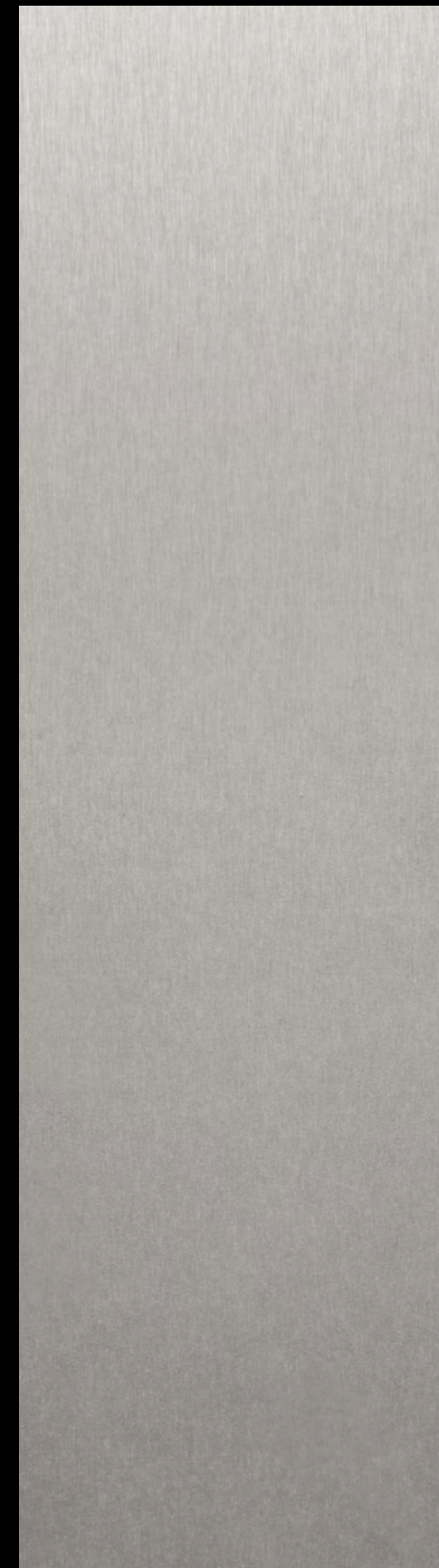
FX 5001 Argento Dukat

Nur Farbmuster. Technische Eigenschaften weichen ab. Colour sample only. Technical properties differ. Échantillon de couleur uniquement. Les caractéris-tiques techniques différent.