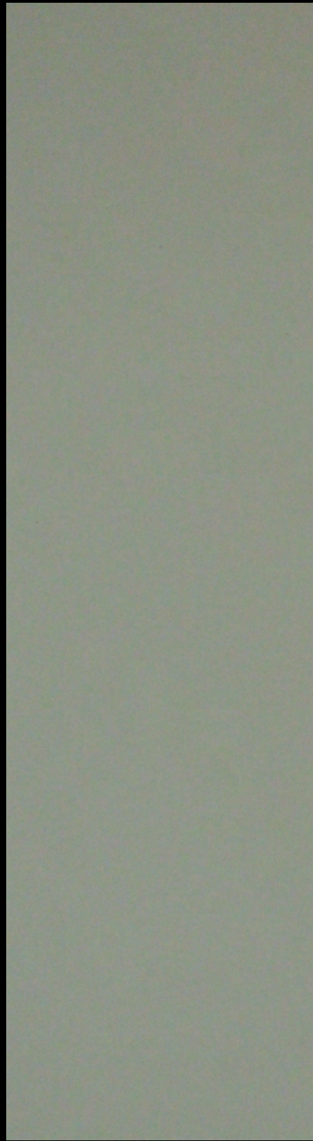
FX 0751 Rosso Jaipur